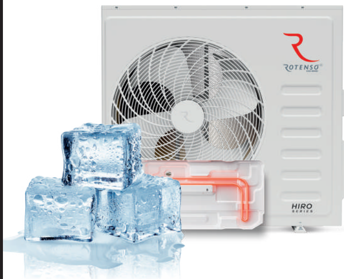
GRZAŁKA TACY OCIEKOWEJ